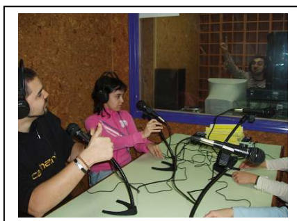
Escuela de Animación y T.L.PUZZLE

El equipo ha de ver como va a realizar cada uno su tarea, como lo van a preparar, recursos a utilizar, necesidades. También ha de establecer un calendario de reuniones tanto para planificar el día a día, como para evaluar también el día a día.